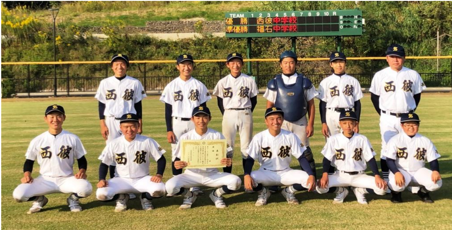
優勝の西彼中学校(西海)