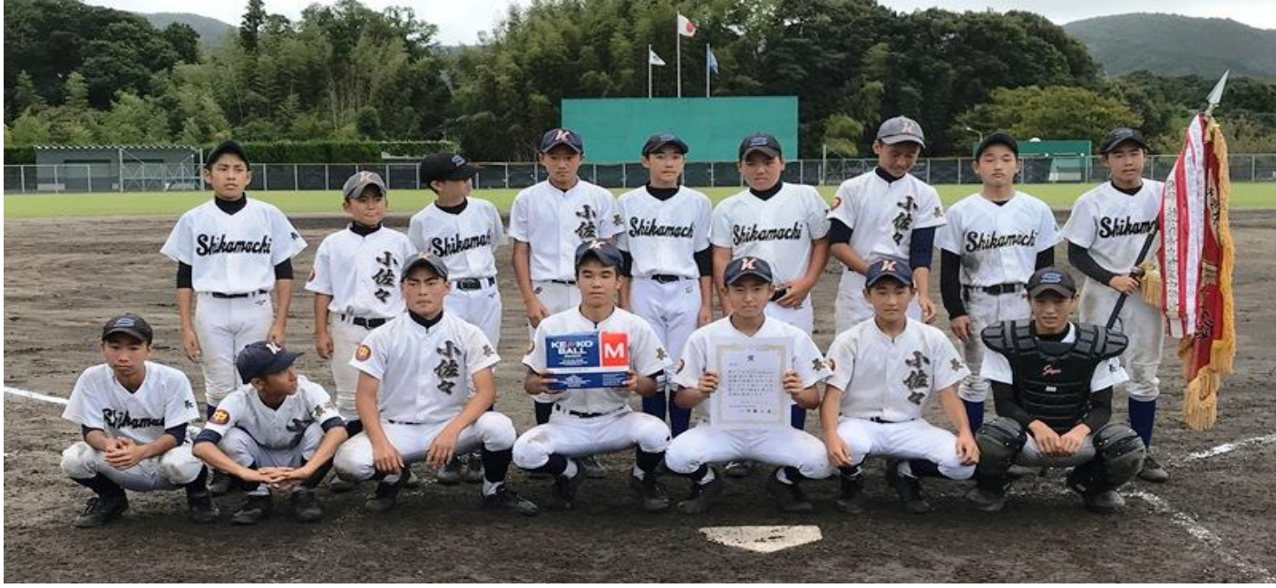
優勝の鹿町・小佐々中学