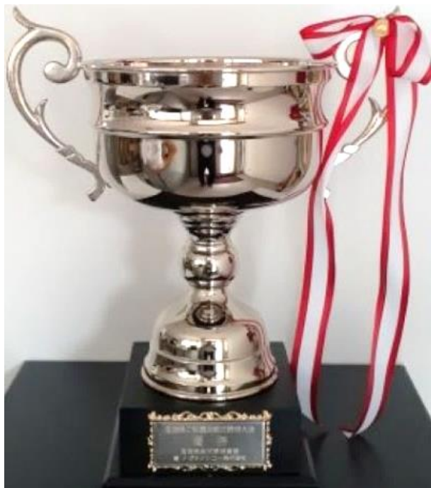
今大会より優勝チームに授与されるナガセケンコー杯