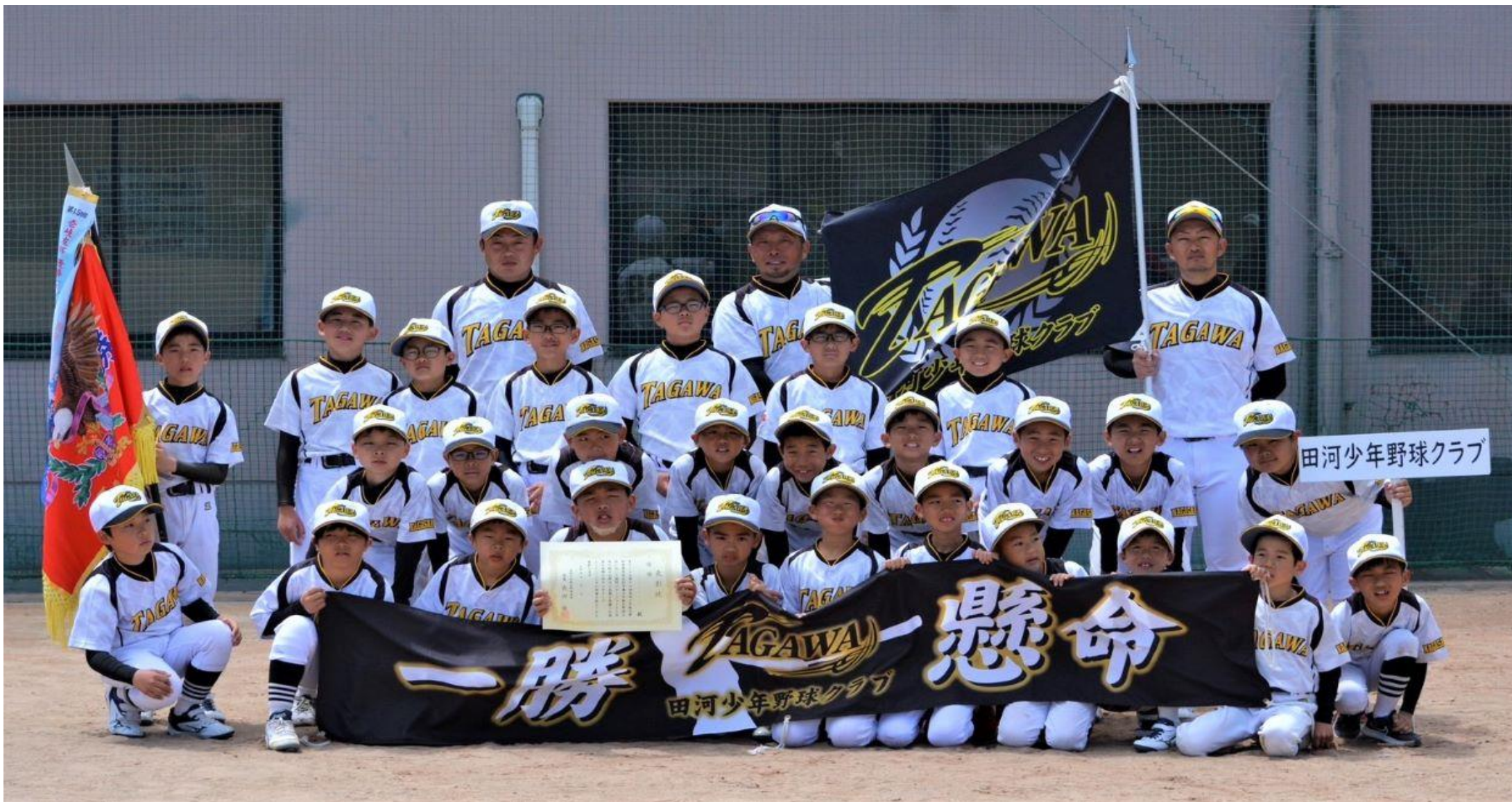
優勝の『田河少年野球クラブ』