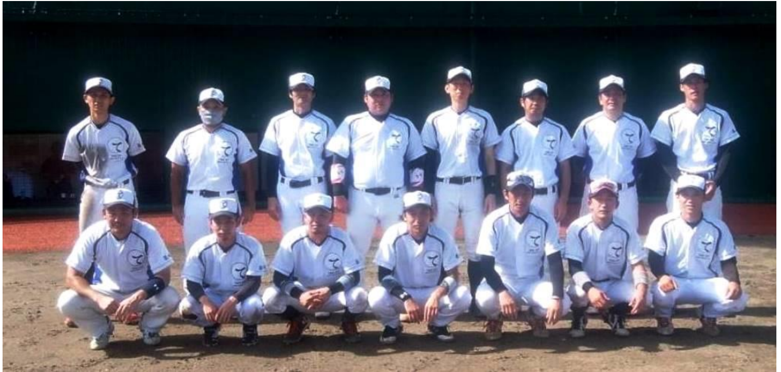
県大会出場を決めた『TAKE OFF』