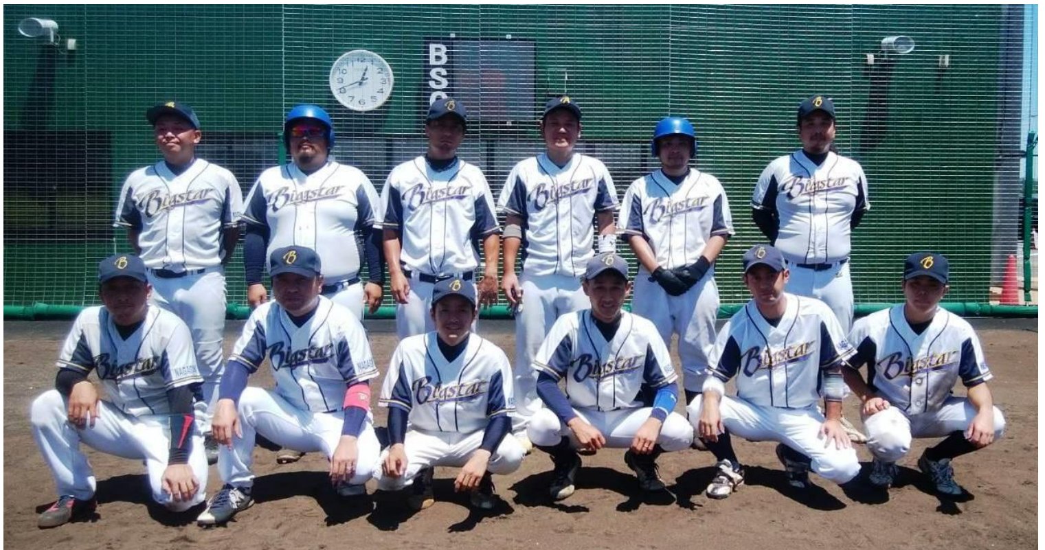
開催地枠で県大会に出場する『ビッグスター』