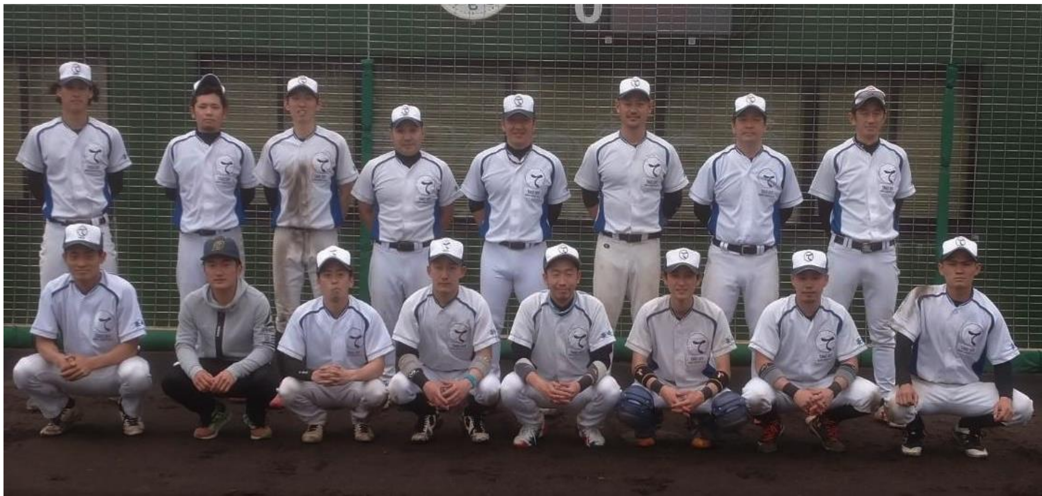
2部予選会で優勝の『TAKE OFF』