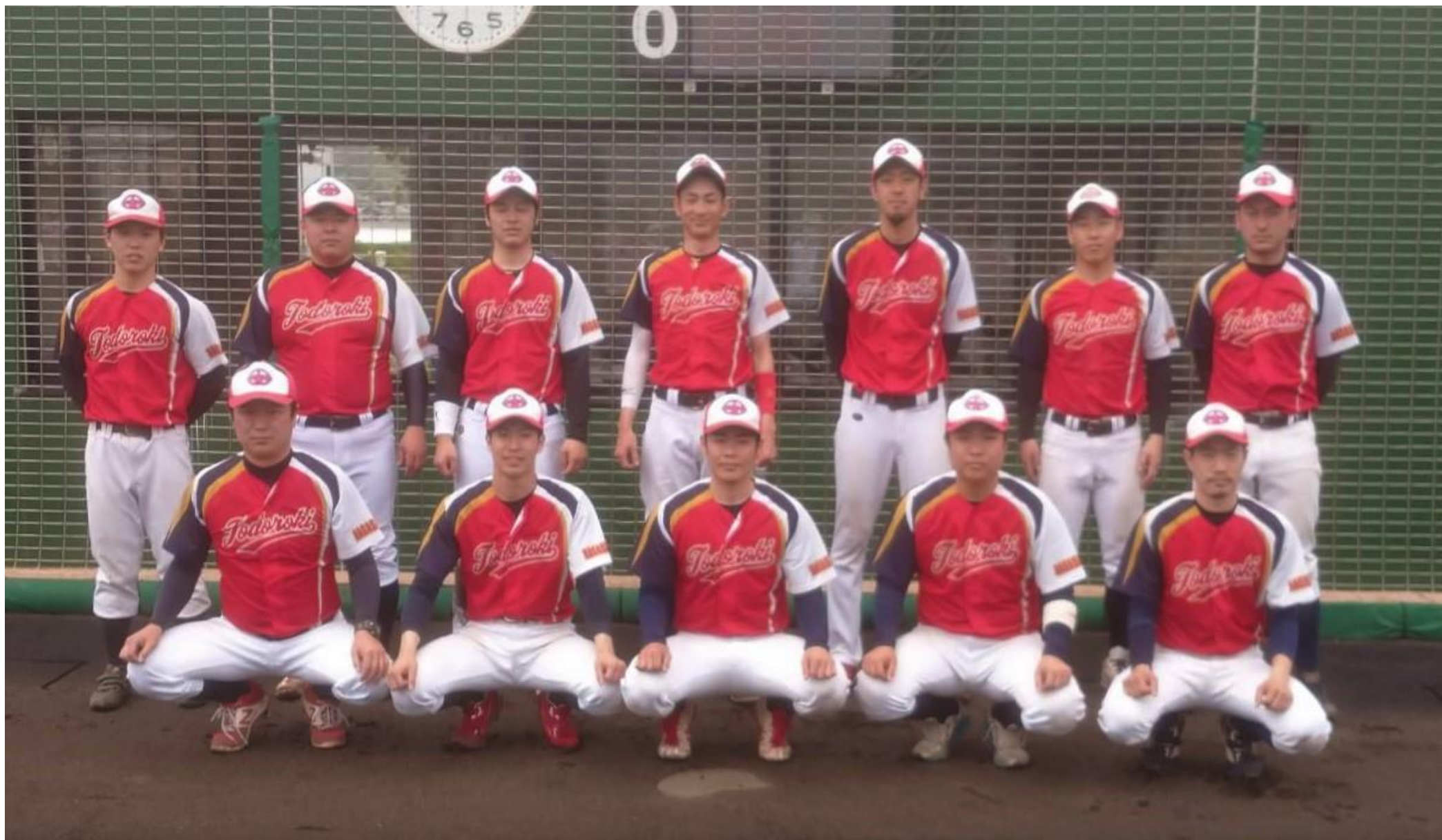
1部予選会で優勝の『轟クラブ』