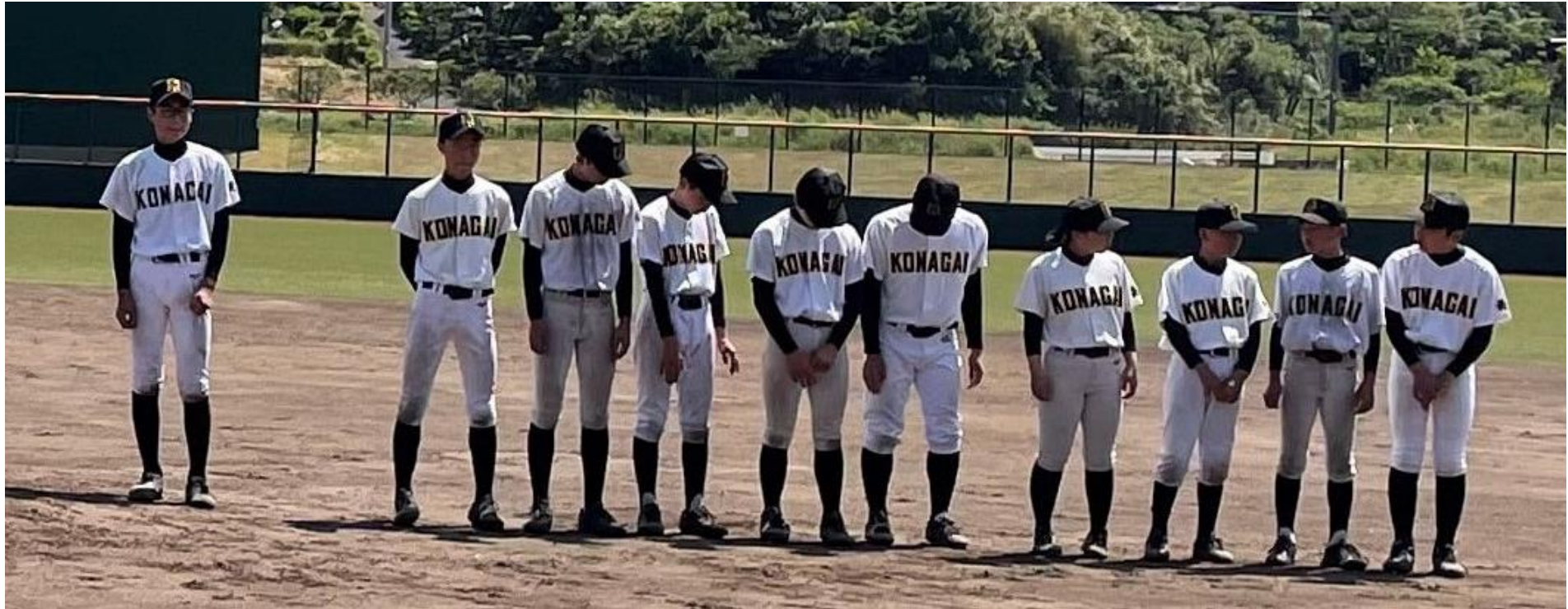
準優勝の小長井中学校