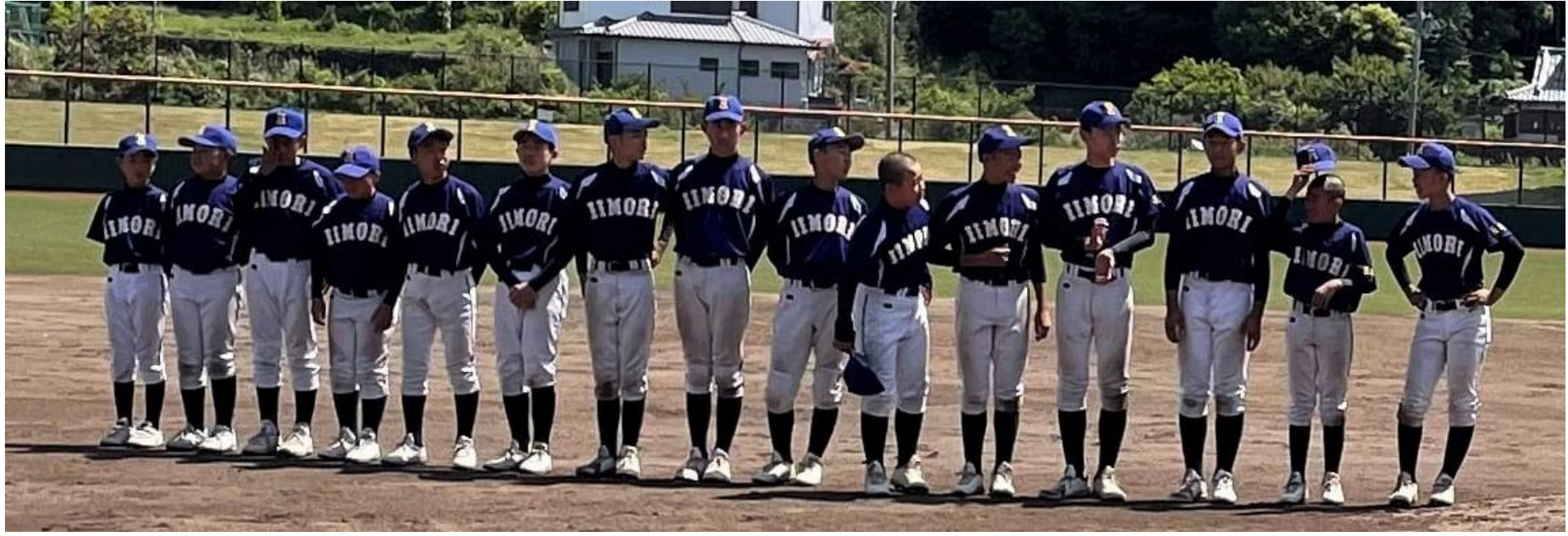
優勝の飯盛中学校