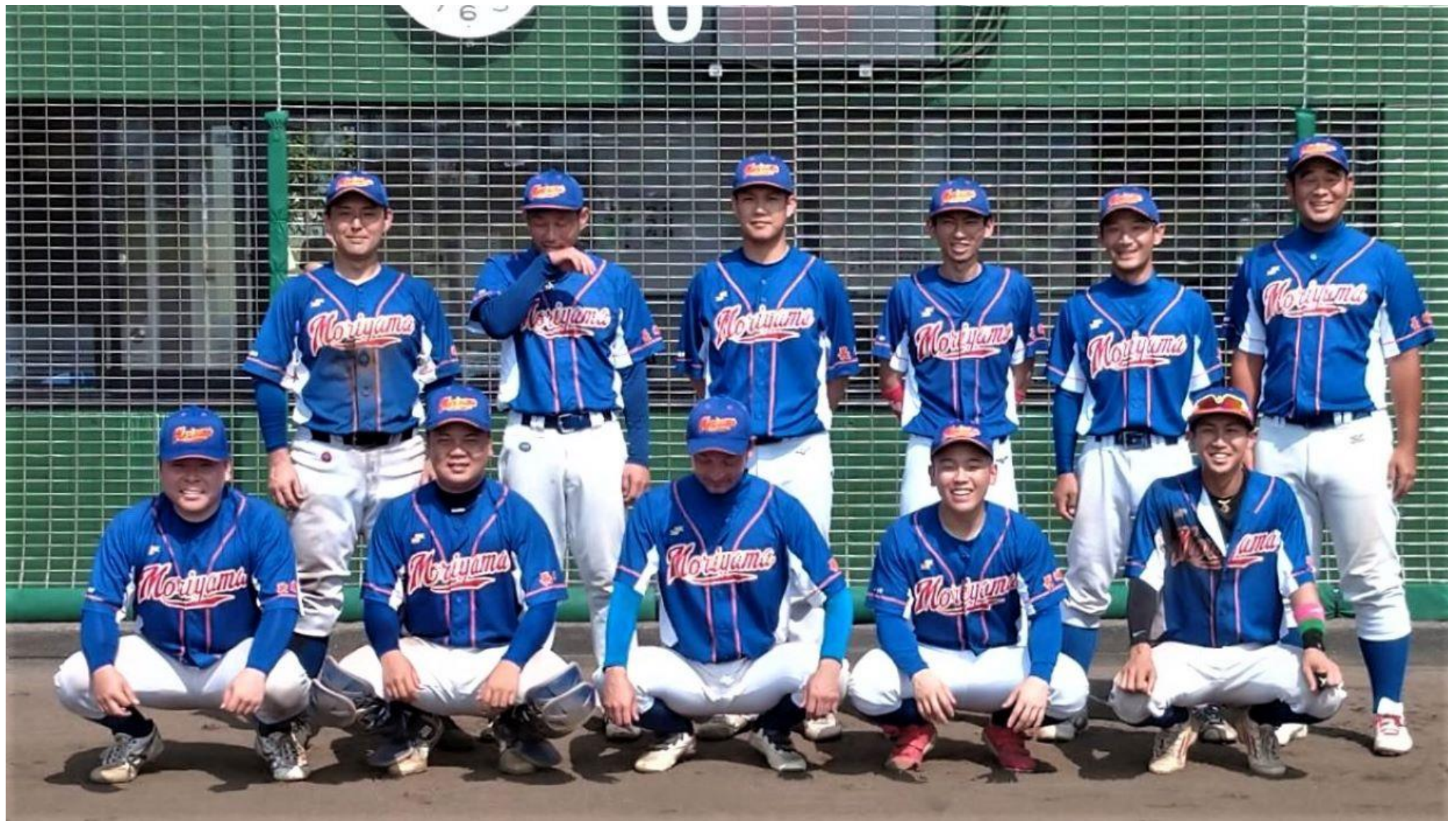
1部予選会で優勝の『森山クラブ』