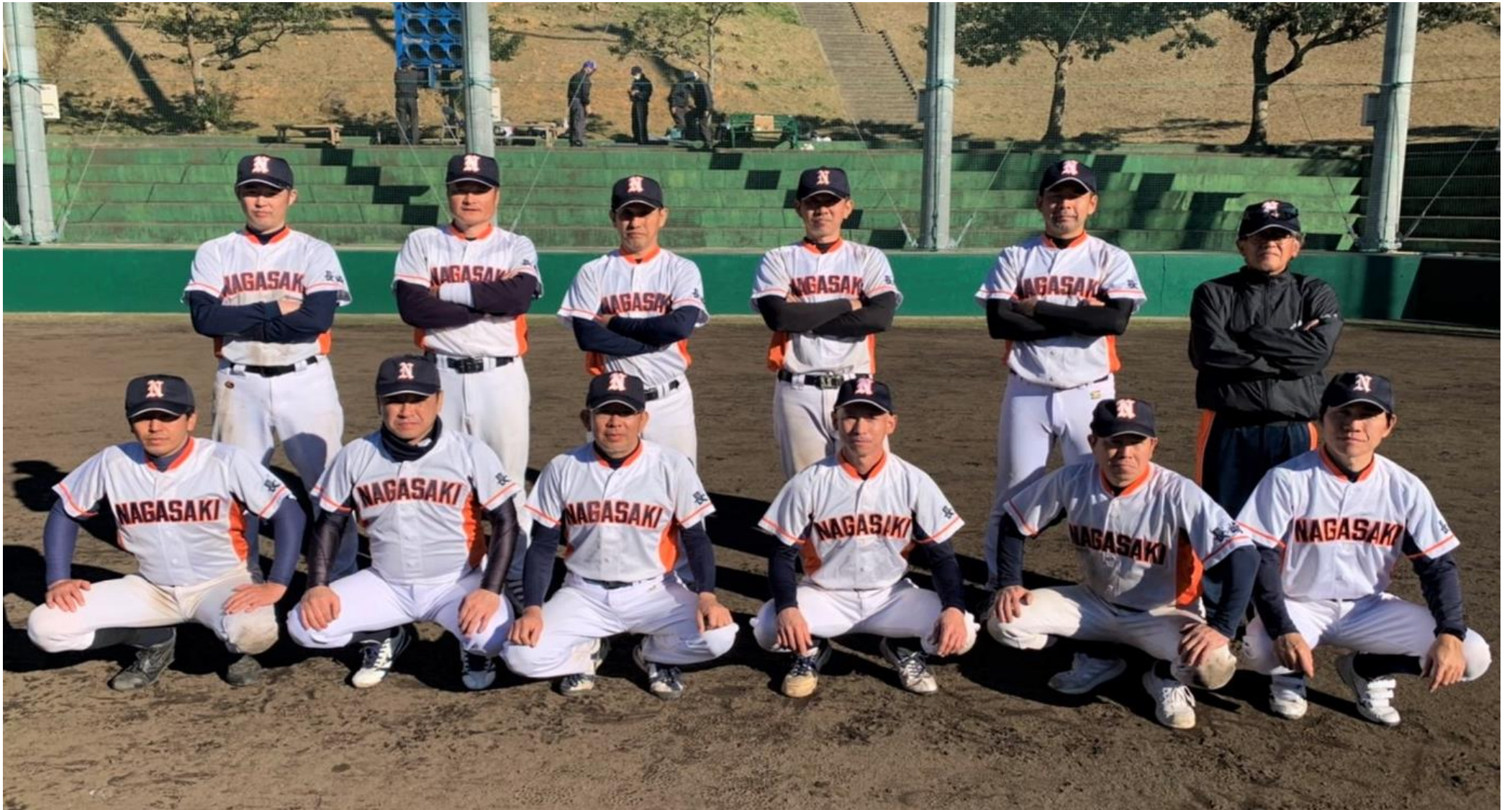
準優勝の『長崎市役所OB』