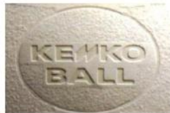
【公認ブランドの証】 ブランド刻印マーク