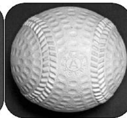
S60年～H17年 空気抵抗を抑え 飛距離を伸ばすために ディンプルの形を 円から楕円に変更