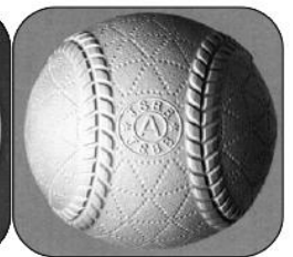
H17年～H29年 縫い目に傾斜を付け 左右対称に ディンプルも小円で 三角形を形成