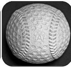
S35年～S43年 ディンプル以外の 余白に☆形を入れ 滑りにくく安定性が増した