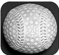
S25年～S34年 ディンプル型で 縫い目が形成