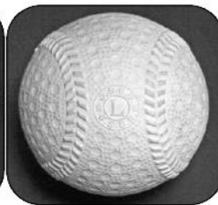
S44年～S59年 従来のA号より外径が 2mm大きくなったL号が登場 一般用で使用