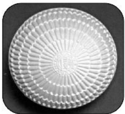
S13年～S24年 割れにくい二重貼りの 菊型健康ボール

バウンドの高さを抑制した 新世代ボール 旧A号より約2g重く 縫い目の数も4個増えて92個に 空気抵抗を減少