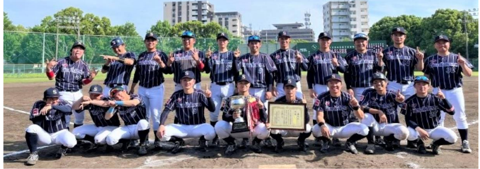
優勝：福岡サニクリーン