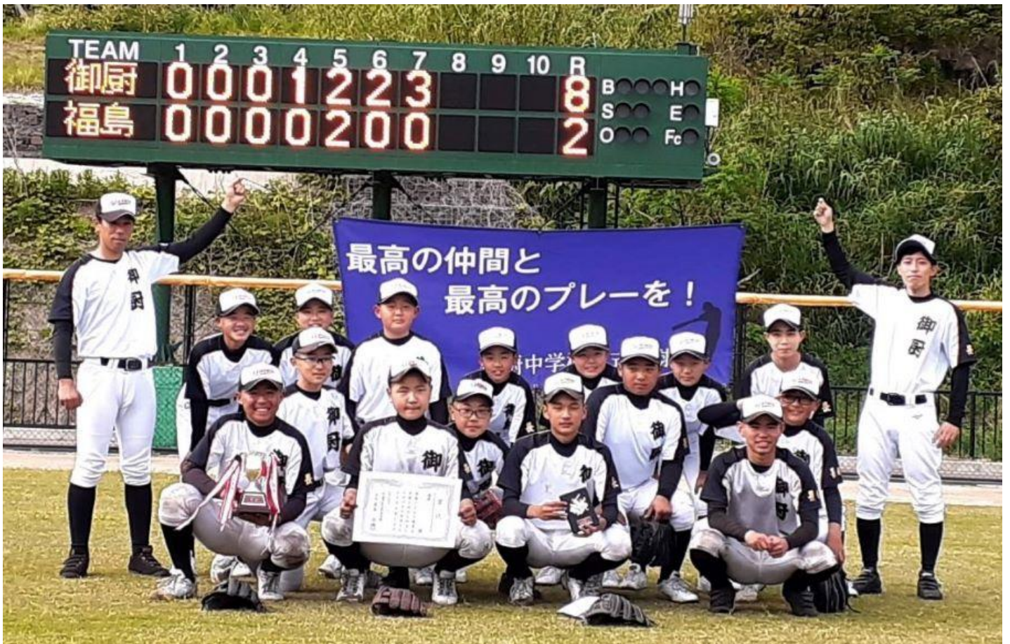
優勝の『御厨中学校』