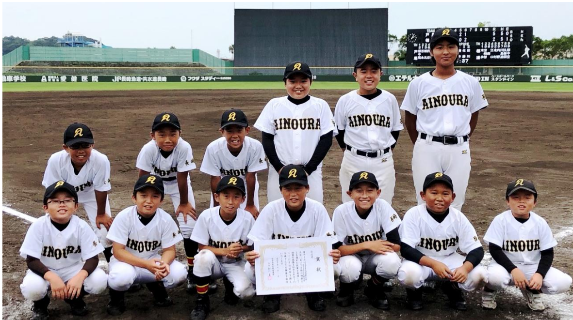
準優勝の『相浦クラブ』