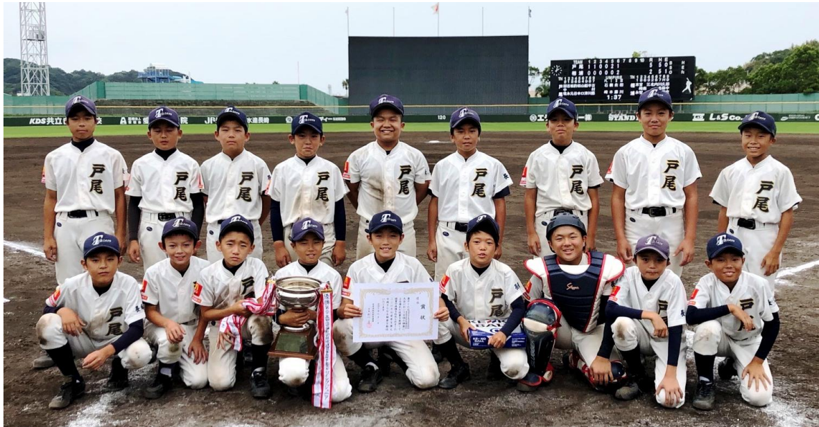
優勝の『戸尾ファイターズ』