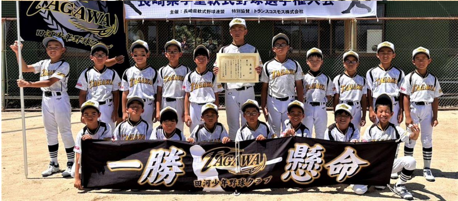
ベスト4で第三位の 『田河少年野球クラブ』