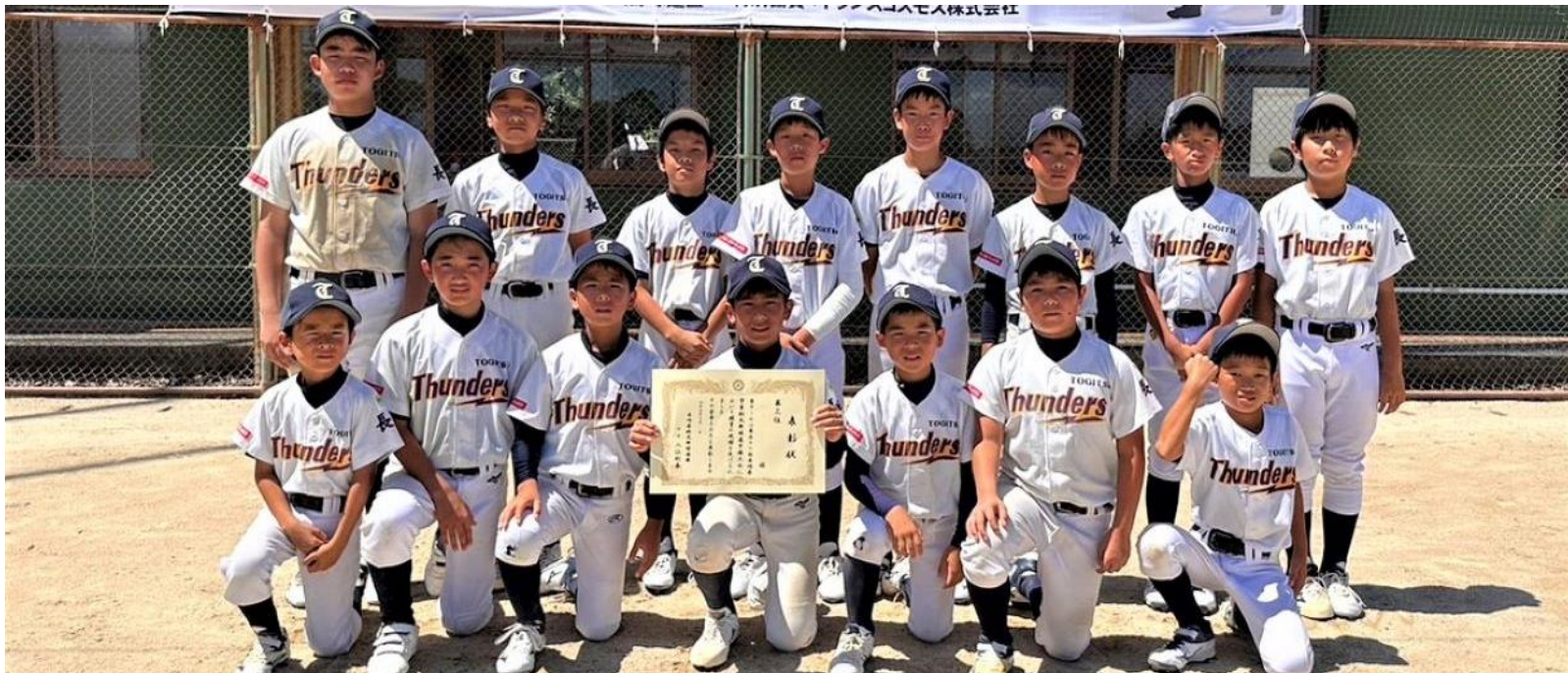
ベスト4で第三位の 『時津サンダース』