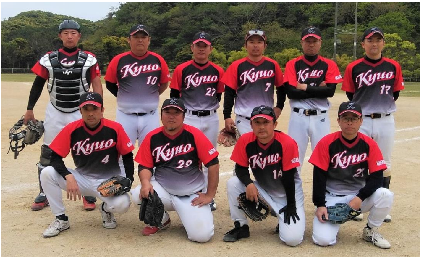
前年秋の県成年予選会に続いて、壮年2大会連続優勝の『球王クラブ』