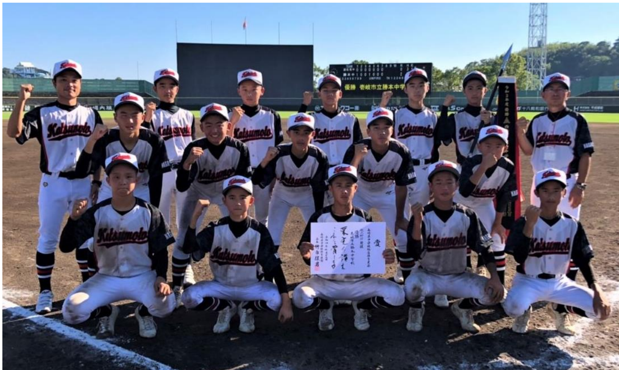
優勝の『勝本中学校(吉崎市)』