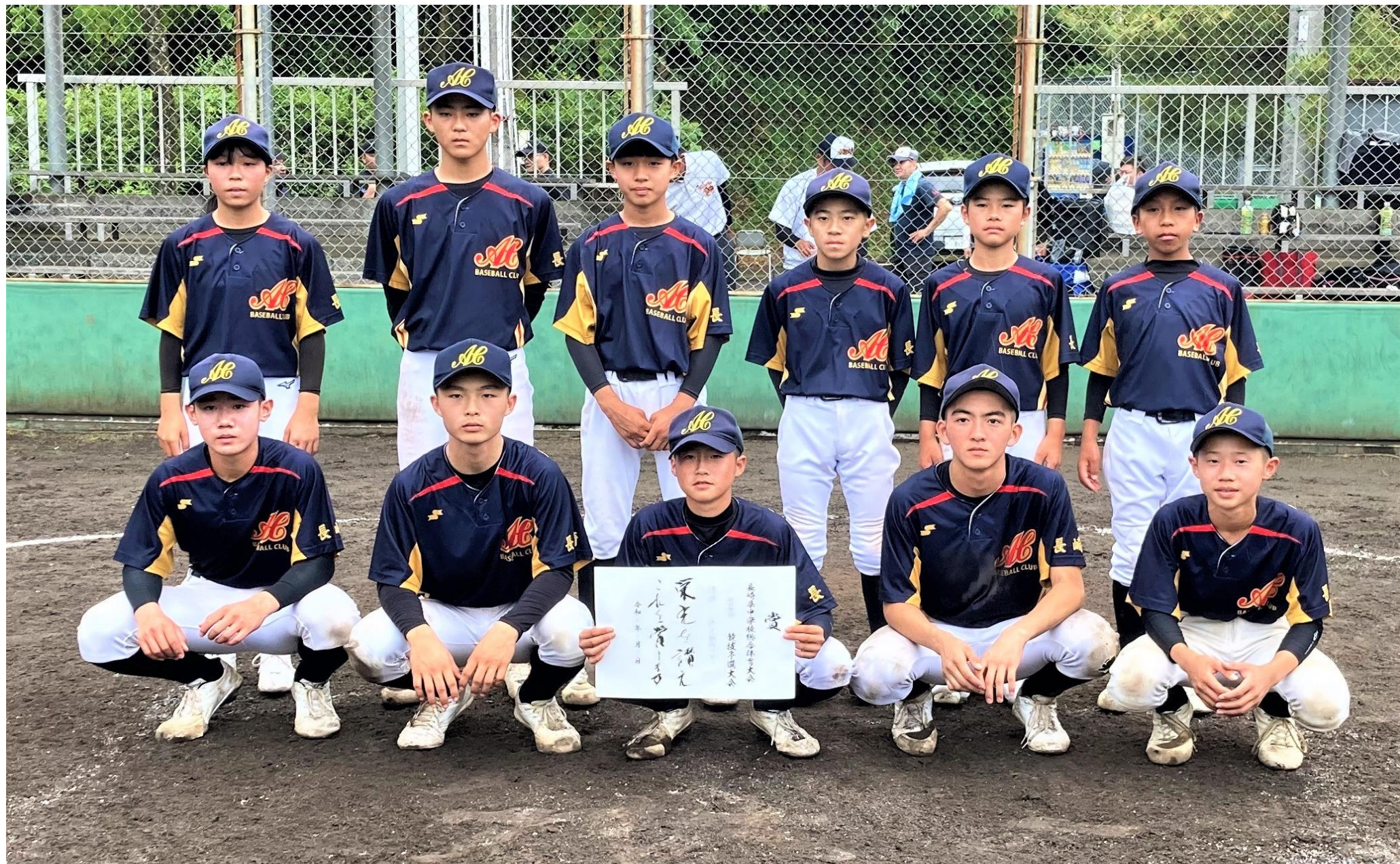
優勝の『ACクラブ(県南支部所属)』は、県中学校総合体育大会に出場する