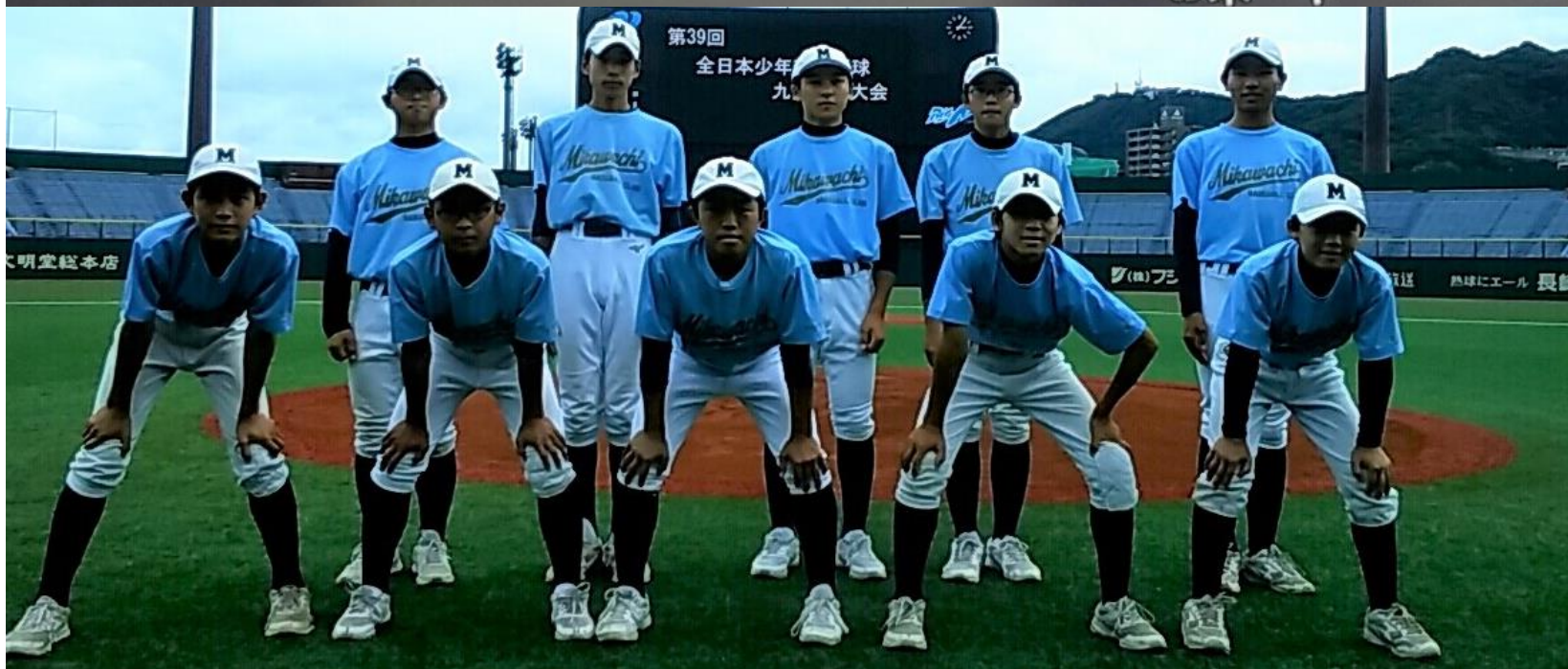
大会二日間、 補助員として協力の 佐世保市立三川内 中学校野球部の皆さん