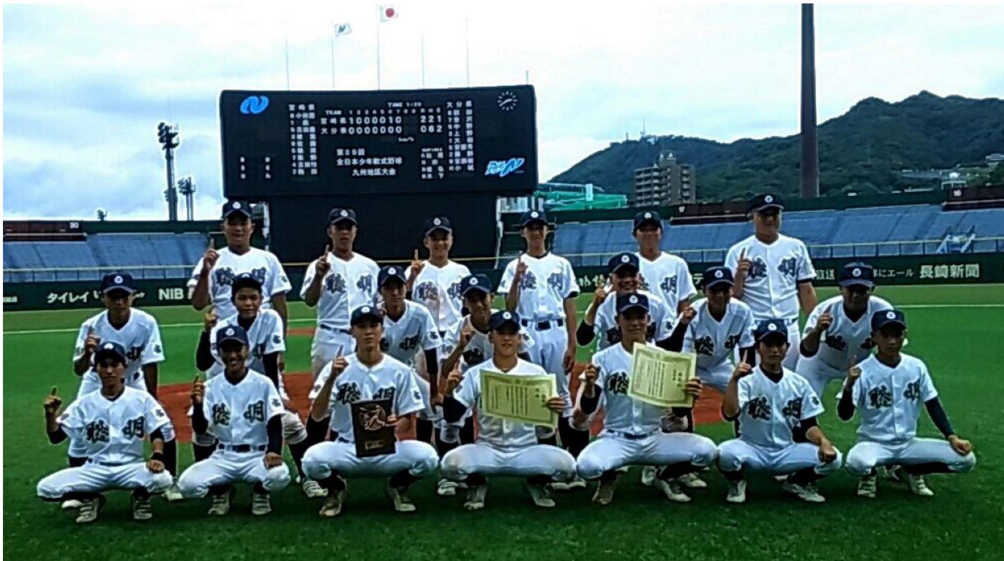
優勝の、聖心ウルスラ学園聡明中学校(宮崎県)